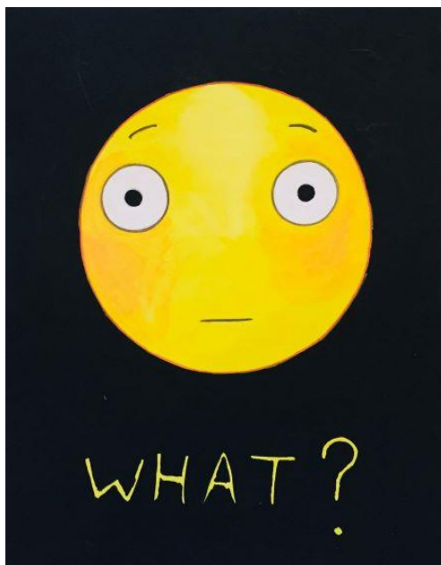
Gouache sur carton (détail), 23 x 19 cm.