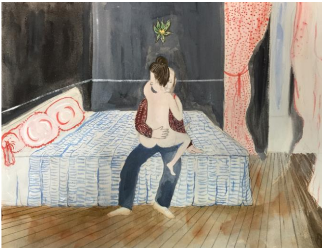
Aquarelle et crayon sur papier, 25 x 32 cm. © Aurélie Salavert.

Elk schilderij, elke tekening, gouache, collage of aquarel op papier van Aurélie Salavert is een originele lezing van de wereld. Haar werken zijn ingegeven door verschillende picturale, literaire, wetenschappelijke en populaire verwijzingen. Toch kunnen we ze niet onderbrengen in de een of andere categorie binnen de hedendaagse kunstwereld. Aurélie Salavert klasseert haar werken evenmin: haar schilderijen hebben titel noch datum, het zijn momenten vol verbazing over het leven. Ze deelt deze momenten regelmatig op haar Instagram-account. Als blijk van verwondering en verrukking krijgt ze er hartjes en 'emoji' voor terug.