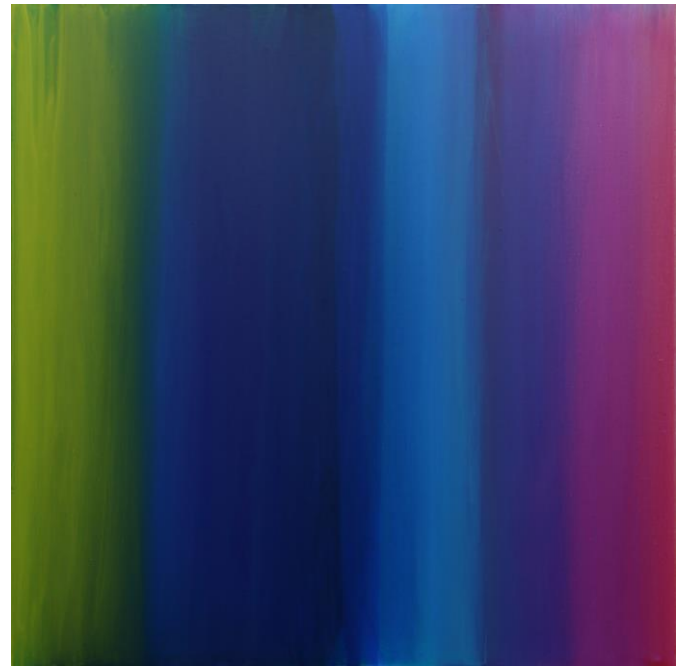
Luci chiare sfumate (left) & Blu e tanto altro (right) 2019, Acrylverf op canvas, 120 x 120 cm.