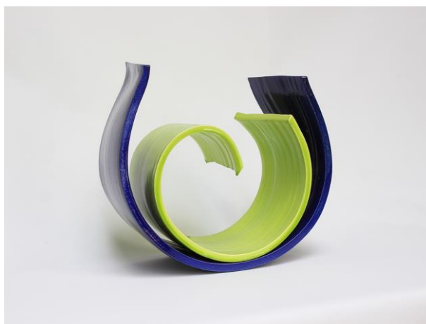
Aperta , 2007, gemaald zandsteen, 45 x 42 x 20 cm.