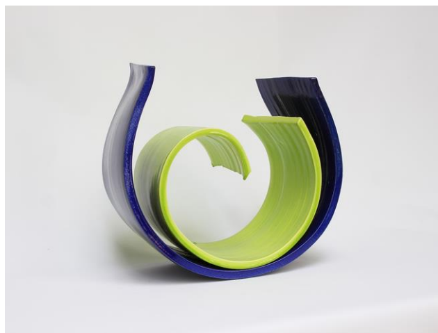
Aperta, 2007, glazed stoneware, 45 x 42 x 20 cm.