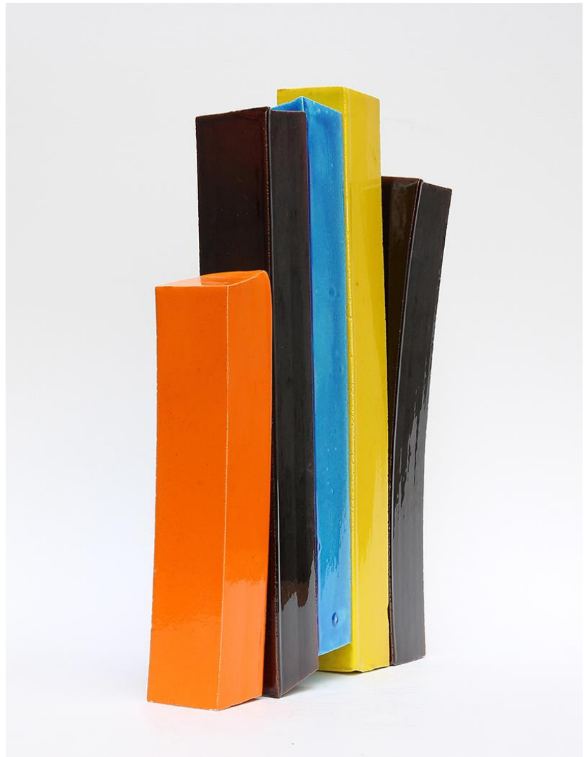
Quasi dritte, 2018, glazed stoneware, 42 x 30 x 9 cm. ©Alberto Cont, Galerie Alice Mogabgab.

La couleur est au centre de cette recherche abordée différemment à chaque nouvelle série d'œuvres. Ce principe de série lui permet d'approfondir la réflexion, d'imaginer quantité de variations en jouant sur les rapports de couleurs comme sur les effets de matière. [...]